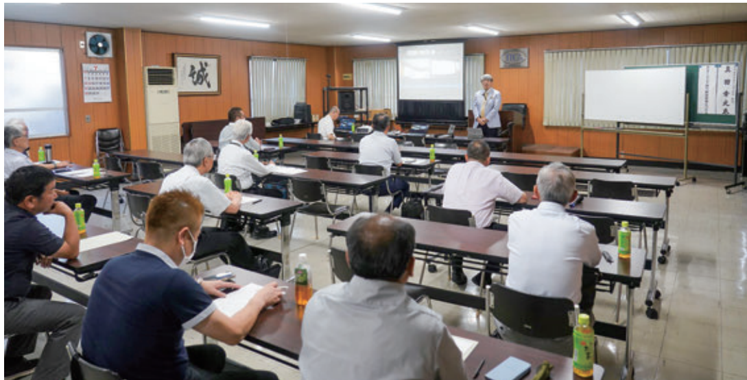
セミナー会場の様子

今後も皆さんに喜んでもらえるようなセミナーを開催するべく頑張つてまいりますので、出席の程よろしくお願いたします。（次回はお弁当復活です。）